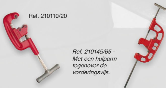
Ref. 210145/65 - Met een hulparm tegenover de vorderingsvijs.