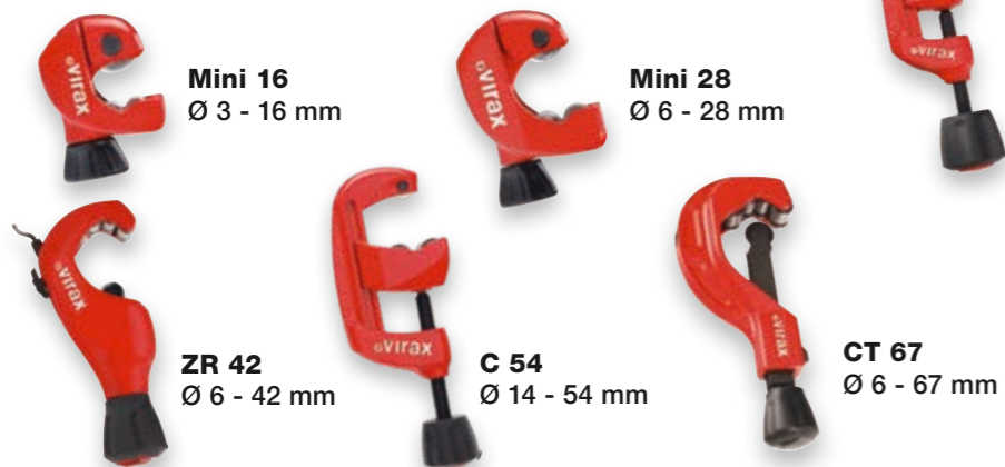
C 28 Ø 6 - 28 mm ZR 35 Ø 3 - 35 mm