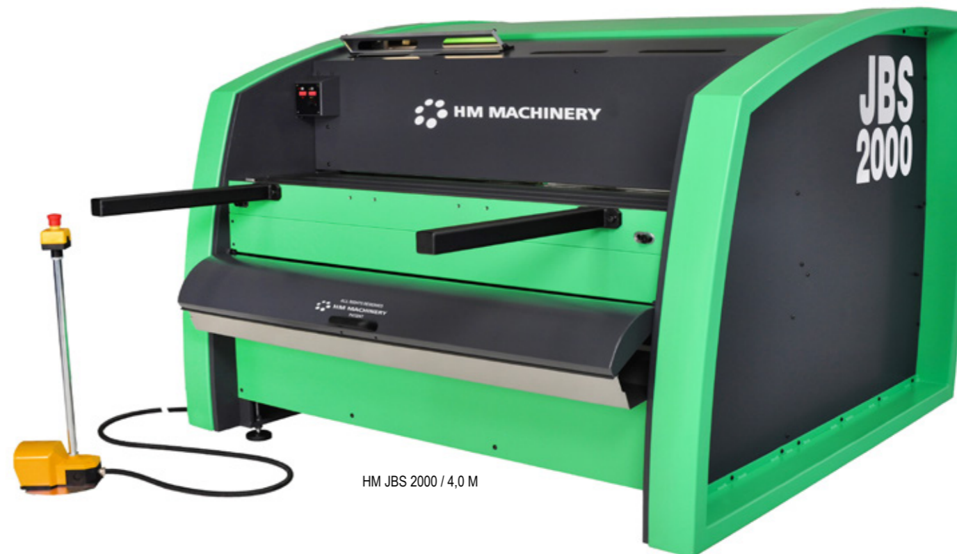
HM JBS 2000 / 4,0 M