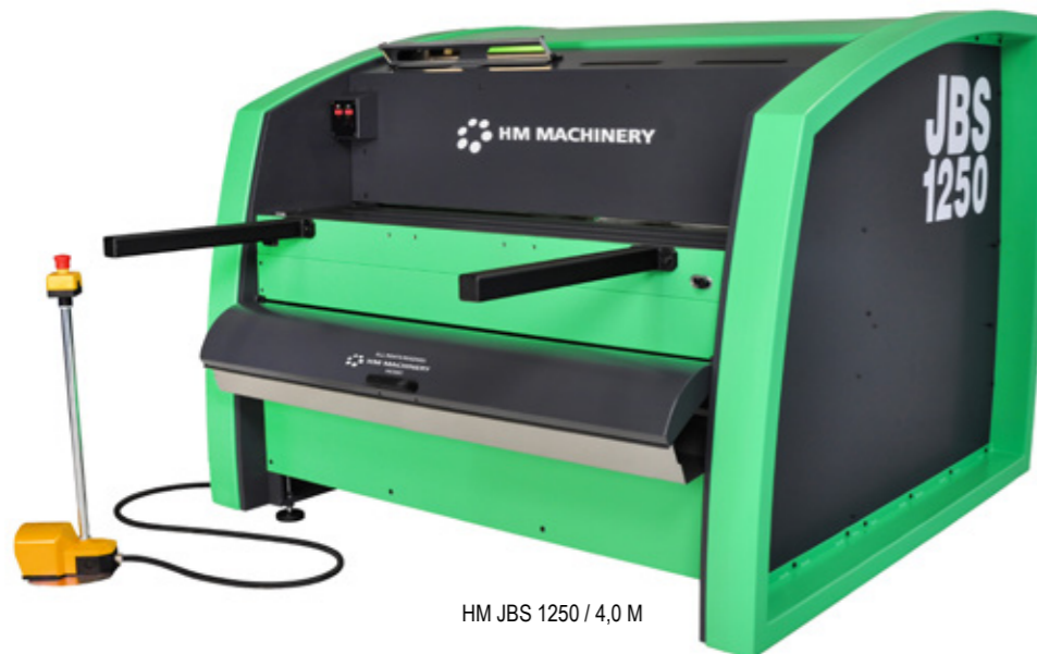
HM JBS 1250 / 4,0 M

🇩🇪 Das patentierte RTO System ( Zurück zum Bediener ) ist Standard bei allen JBS-Scheren