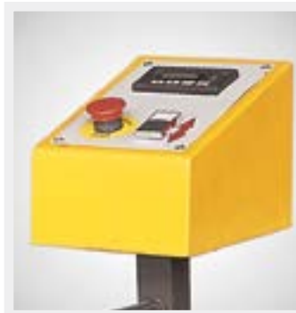
Opsiyonel dijitalli kumanda paneli (sadece motorlu arka top ile uygulanabilir) Optional control panel with digital readout (only applicable with motorised back roll)