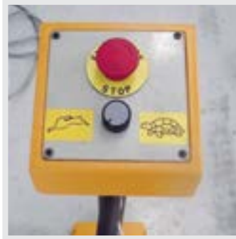
Opsiyonel kademesiz ayarlanabilir hız sistemi Optional variable speed system