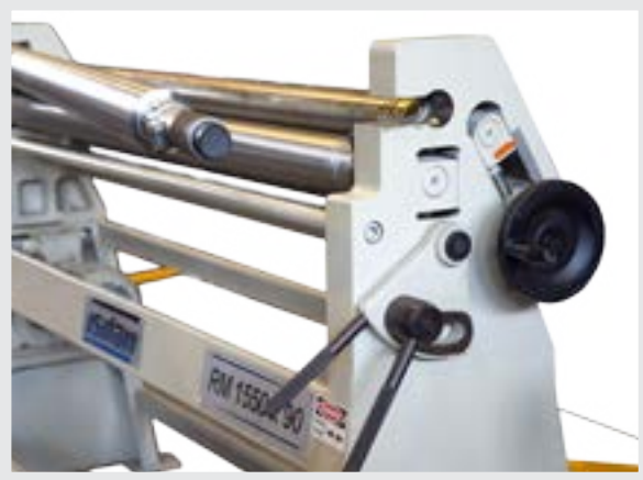
Standart Elle Açılabilen Sac Çıkarma Kafası Standard Manual Dropend