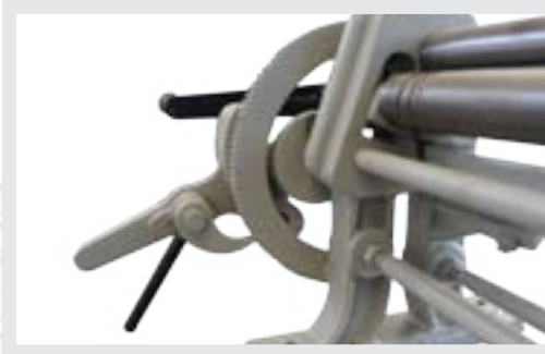
Dişli Ay Çarkı ile hızlı Arka-Top ayarlama With Geared Lock, Easy Backr Roll Adjustment

» Minimum çap üst top Ø x 1.5 katı » Minimum diameter top roll Ø x 1.5 times