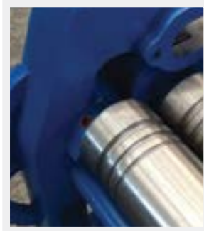
Standart Tel Kanalları Wire Grooves as standard