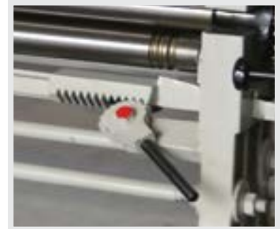
Kolay Alt top Sıkıştırma kolu EASY Bottom Roll Pinching