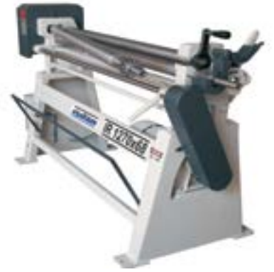
Standart Elle Açılabilen Sac Çıkarma Kafası Standard Manual Dropend