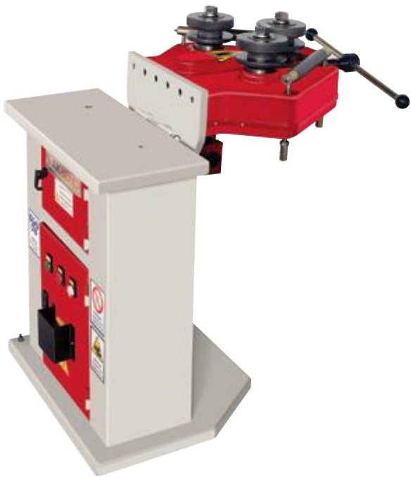
Twisting Attachment. Burgu Aparatı.